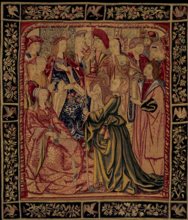
Scène de Cour, réalisée probablement à Bruxelles, début du XVI e siècle, laine et soie, 259 x 228 cm.

FONDÉE EN 1889, elle compte parmi ses clients les plus grands musées, dont le Louvre, le Victoria & Albert Museum, le Rijksmuseum, le Mobilier national-Manufacture des Gobelins, l'Art Institute of Chicago... C'est donc tout naturellement que les trois plus grandes campagnes de conservation de tapisseries de ces trente dernières années lui ont été confiées. La réputation de ses activités et son accès direct à des