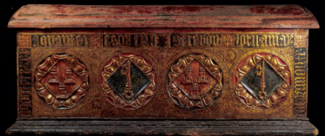
Cassone italienne d'époque Renaissance.