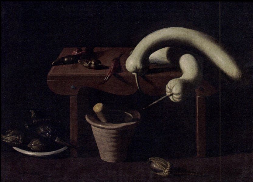
Francisco de Zurbarán (Fuente de Cantos, Badajoz 1598-1664 Madrid), Nature morte de Carême , XVII e siècle.

Parmi les œuvres phares choisies, citons une Nature morte aux artichauts et calabasses de Francisco de Zurbarán, d'un dépouillement prenant, ou encore une Adoration de la Croix de Francisco de Goya, parfaitement documentée.