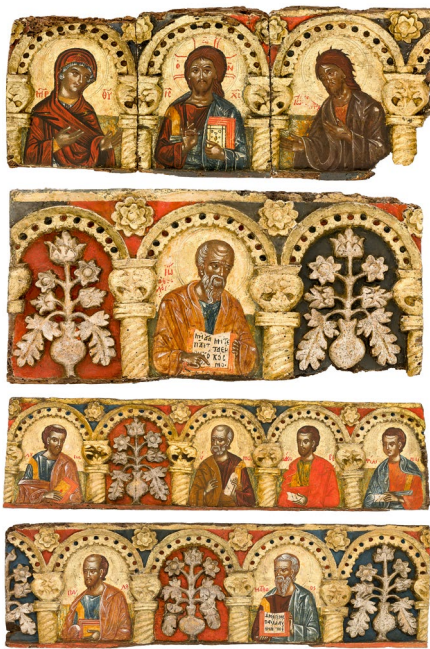
Heutink Ikonen - Deesis and Apostle row Asia Minor 17 th Century