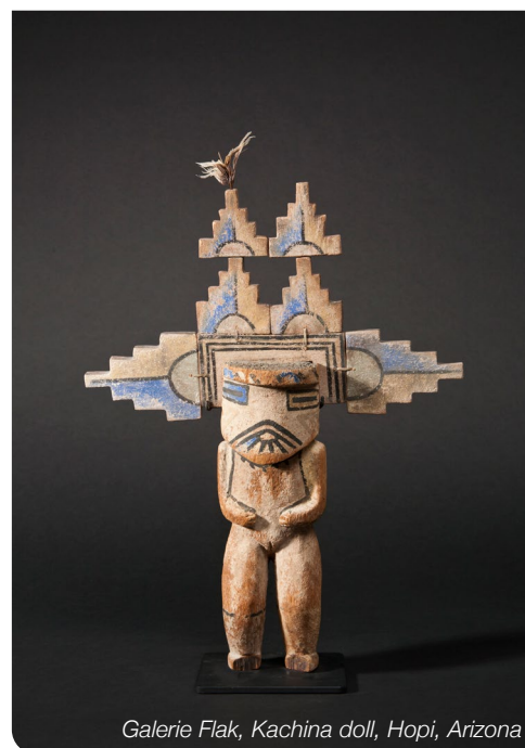
Galerie Flak, Kachina doll, Hopi, Arizona

BRAFA, ONE OF THE HIGHEST-QUALITY INTERNATIONAL FAIRS IN EUROPE FOR COLLECTORS AND ART ENTHUSIASTS, IS PREPARING ITS 69 TH EDITION SCHEDULED FROM JANUARY 28 TH TO FEBRUARY 4 TH , 2024 AT BRUSSELS EXPO.