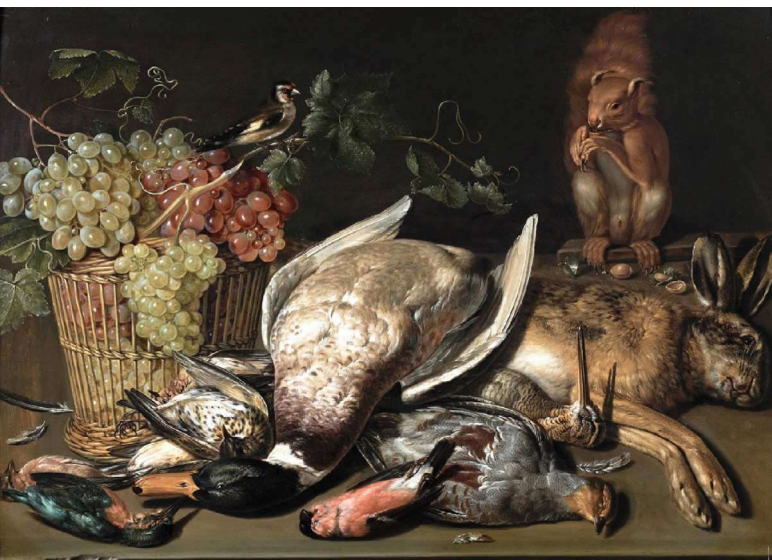
Clara Peeters, Nature morte aux colvert, lièvre, écureuil et panier de raisin,

1 ère moitié du XVII e siècle, huile sur panneau, 50,8 x 74,6 cm. Galerie de Jonckheere, Genève.