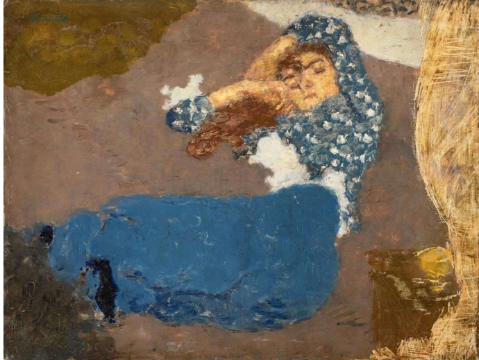
Pierre Bonnard, Jeune femme endormie,