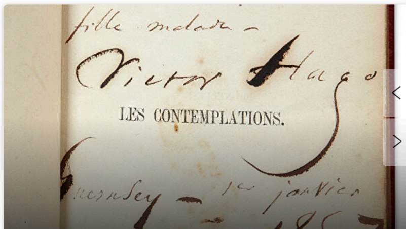
Виктор Гюго, сборник "Les Contemplations"