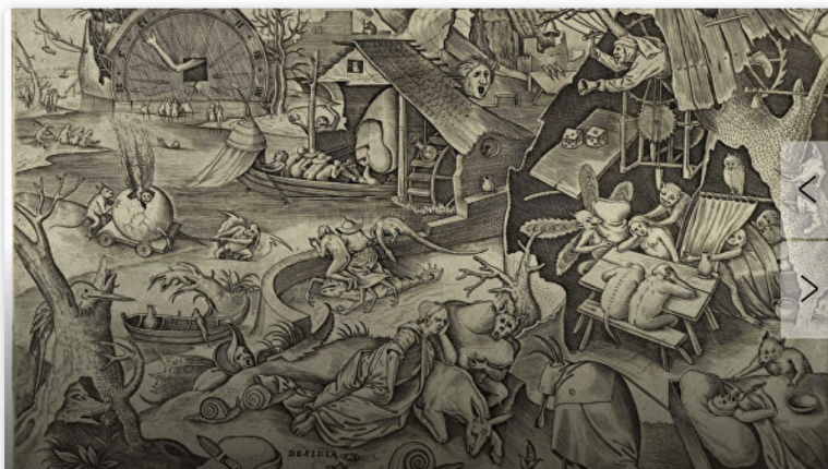
Питер Брейгель Старший. Гравюра "Лень"

Примечательно, что параллельно с работой ярмарки, в Королевской Библиотеке Брюсселя проходит выставка графики этого мастера "Мир Брейгеля в черно-белом цвете", на которой представлены и работы из этой же серии.