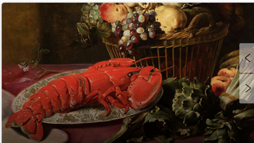
Франс Снейдерс. "Натюрморт с лобстером, артишоками, спаржей и фруктами"