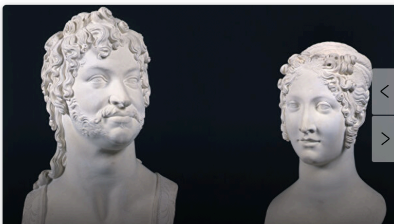
Антонио Канова. Бюст Иоахима Мюрата и Каролины Бонапарт

Есть на BRAFA и скульптура: среди редких предметов на ярмарке покажут гипсовые бюсты сестры Наполеона Бонапарт Каролины и ее супруга Иоахима Мюрата, созданные венецианцем Антонио Канова. Они оцениваются в 400 тысяч евро, а их варианты из мрамора хранятся в Историческом музее в Москве, куда они попали из коллекции Щукина. Варианты, представленные на BRAFA, происходят из коллекции королевской семьи Баварии.