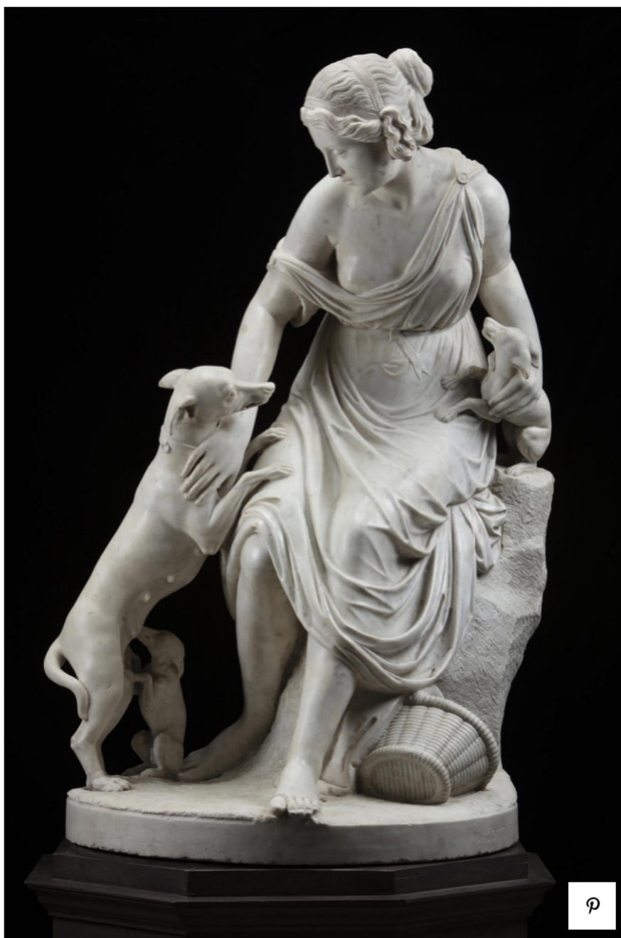
Джозеф Готт, "Женщина с собаками", 19 век, (Англия), белый мрамор. В 108 см; Ø основание 65 см, подпись 'J. GOTT Ft.' на основании, галерея Brun Fine Art, 110 000 евро.

Бывая в Лондоне, я по возможности захожу в Музей Виктории и Альберта и всегда стараюсь пройти через галерею скульптуры 19 века. Поскольку меня нередко приглашают для работы над особняками, я отсматриваю эталонные вещи. Данная работа англичанина Джозефа Готта – образец качественной скульптуры, которая украсит холл самого изысканного особняка.