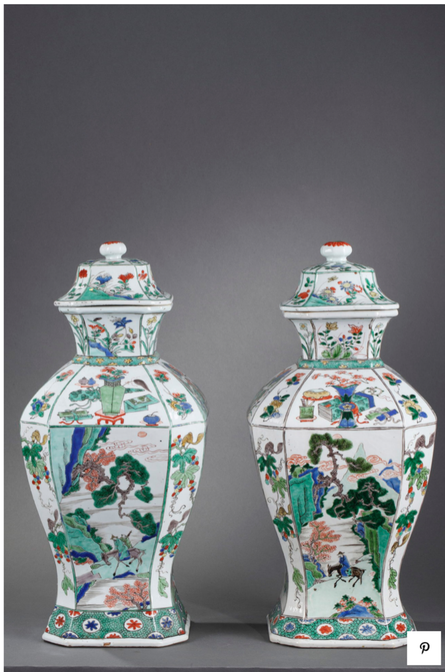
Парные китайские фарфоровые вазы с крышкой "зеленого семейства", эпохи императора Канси (1662-1722), В 52 см, галерея Bertrand de Lavergne, 36 000 евро.

Почти ни один мой интерьер не обходится без китайских ваз того или иного периода. Эпоха Канси – расцвет периода династии Цин. Это прекрасный образец "зеленого семейства" с красивой формой и замысловатым орнаментом, который можно изучать до бесконечности: основного персонажа всадника на ослике окружают тонко созданные пейзажи с птицами, белками, пышной растительностью и горами. Ценность данных ваз еще и в их парности.