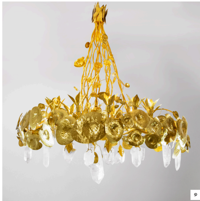
Робер Гуссенс, люстра "Водяная лилия", бронза, латунь, горный хрусталь, Франция, 1970-е годы. В 128 см, Ø 110 см, подписана и датирована, галерея Maison Rapin, 85 000 евро.

Мимо люстры одного из любимых ювелиров Коко Шанель пройти невозможно. Именно для нее Робер Гуссенс создал первые предметы декора, в том числе и знаменитую серию со снопами пшеницы. Он работал и с другими великими кутюрье 20 века. Модель данной люстры с крупными кристаллами, которые я так люблю, была первоначально создана для Ива Сен-Лорана в 70-х годах. Если бюджет позволяет, то именно такие предметы я предлагаю своим заказчикам, а не “каталожные”. Это высокое искусство.