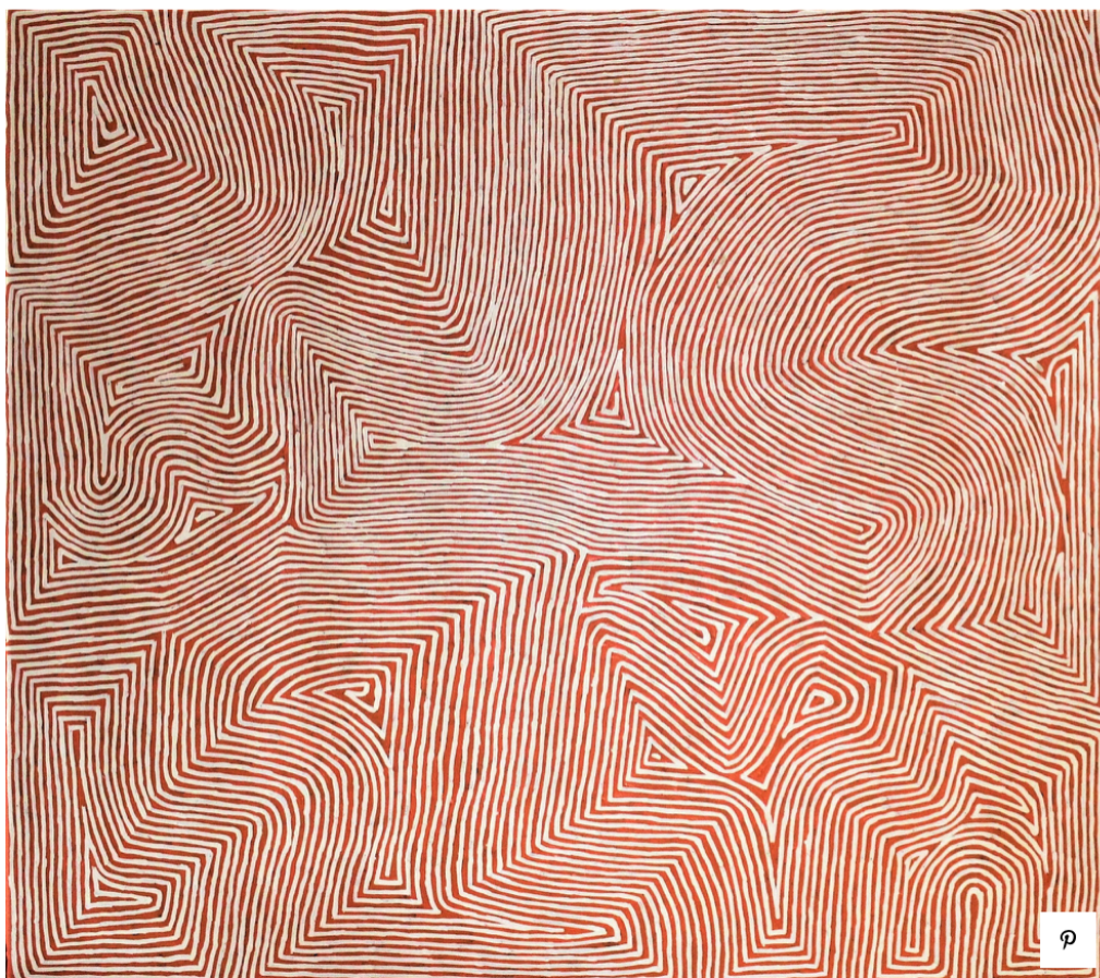
Джордж Хэйрбраш Тьюнгаррай. "Mamultjulkunga", 2018, Австралия, акрил на холсте, 112 x 102 см, галерея Mathivet, 17 000 евро.

Во время путешествия в самое сердце Австралии я познакомилась с искусством аборигенов. На первый взгляд декоративные орнаменты несут в себе глубокий смысл. Это целые саги о предках и о природе австралийского региона. Например, каждый цвет соответствует своей стихии. Автор должен быть посвященным, чтобы ему было позволено работать в том или ином стиле. Работы на холсте, которые составили основу современного арт-рынка искусства австралийских аборигенов, стали создаваться в 1970-х годах. Один из современных монументальных образцов росписи австралийских аборигенов можно встретить на входе в парижский музей на набережной Бранли. Тьюнгаррай – обладатель многочисленных международных призов. Его темой является повествование о предках и пейзажах его родных краев в Восточной Австралии.