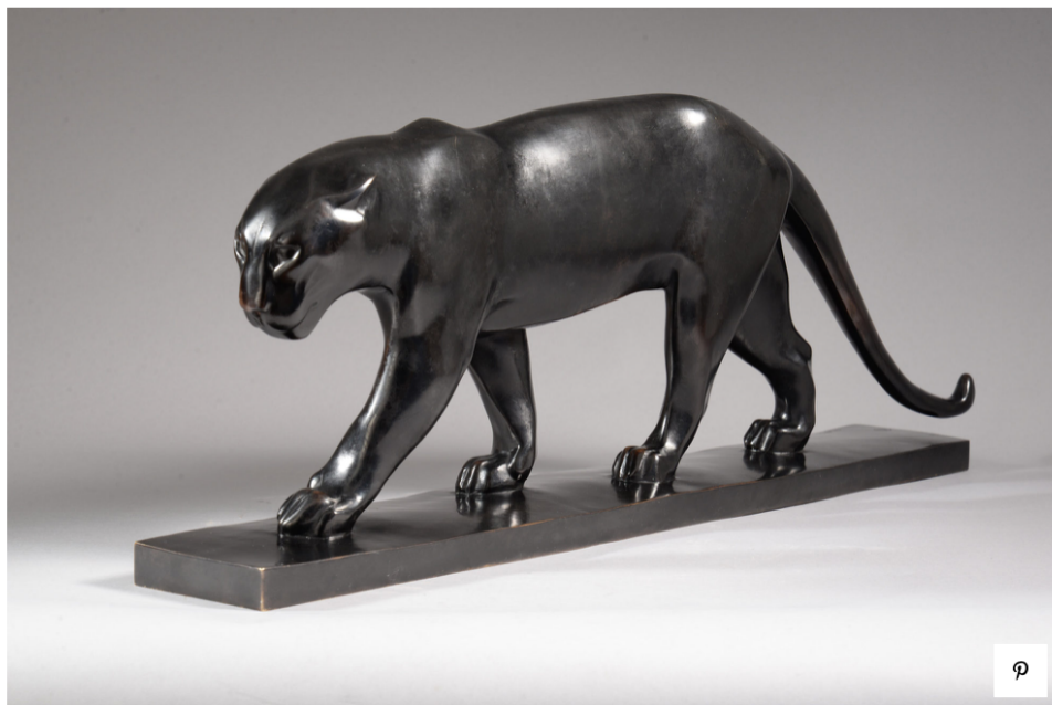
Шарль Артюс, "Большая пантера", 1931 год или ранее, Франция, бронза, многоплановая темно-коричневая патина, В 25.5 x Ш 68.2 x Г 10 см, авторское издание с подписью "Ch Artus", и монограммой "CA", Галерея Univers du Bronze, 130 000 евро.

Скульптура хищников семейства кошачьих очень востребована среди моих заказчиков, но найти высококлассное произведение не так-то просто. Это уникальная скульптура ученика одного из самых великих анималистов 20 века Франсуа Помпона. Чаще можно встретить птиц Артюса, а вот пантера попалась впервые. К тому же это прижизненная отливка и, судя по качеству патины, этот экземпляр предназначался для показа на престижных художественных салонах того времени.