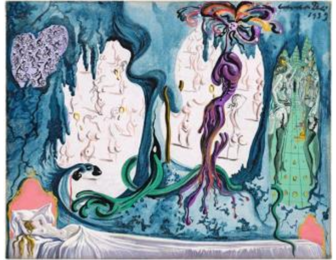
Salvador Dalí (1904-1989), progetto per un tableau vivant Il sogno di Venere, 1939

Nel giugno 1939, su richiesta di Julien Levy, il mercante d'arte americano che aprì le porte al surrealismo negli Stati Uniti, Salvador Dalí progettò un padiglione per la Fiera Mondiale di New York chiamato "Dream of Venus". Per accedere al padiglione bisogna passare sotto colonne formate da due gambe femminili, tra le quali si trova anche la biglietteria, collocata all'interno della testa di un pesce. È in questo quadro che l'artista concepisce il progetto di un tableau vivant intitolato "Il sogno di Venere" che rappresenta la femminilità e l'arte della seduzione attraverso busti di nudo, dove la donna perfeziona il suo aspetto con l'aiuto di uno specchio.