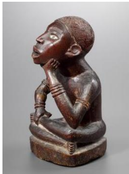
Statua in legno Kongo Yombe o Vili con occhi in pasta di vetro, Repubblica Democratica del Congo, circa 1908