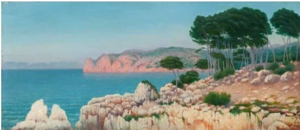
William Degouve de Nuncques (1867-1935), Côte aux Baléares (Majorca, Cala San Vicente)

William Degouve de Nuncques, simbolista belga, esponeva regolarmente con il famoso gruppo di artisti 'Les XX' e La Libre Esthétique. Dal 1900 al 1902, visse a Maiorca e divenne amico degli artisti catalani Santiago Rusiñol e Joaquín Mir, un legame che negli anni seguenti diede vita a importanti scambi tra artisti spagnoli e belgi. Proprio a Maiorca l'artista ha creato i suoi paesaggi più colorati, affascinato dalla magnifica costa di Cala San Vicente con le sue formazioni rocciose rosa e bianche, così brillantemente rese nel dipinto mostrato qui sopra.