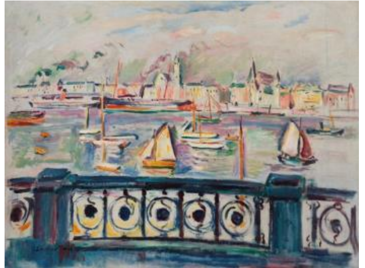
Emile-Othon Friesz (1879-1949), Le port d'Anvers , 1906

Nell'estate del 1906, il viaggio in Belgio di Georges Braque ed Emile Othon Friesz sarà l'occasione per affermare i principi espressivi che caratterizzeranno il fauvismo. I due artisti si stabiliranno ad Anversa, sulle rive della Schelda e proprio all'ingresso del porto, dedicandosi esclusivamente alle vedute marittime e dirigendo la loro ricerca artistica verso l'emancipazione del colore. Con la sua luce brillante, questo dipinto è caratterizzato da un tocco libero e da un'esplosione di colori puri. Emile-Othon Friesz offre qui una vista inedita del porto di Anversa visto dalla terrazza dell'ex casinò "Le Kursaal"