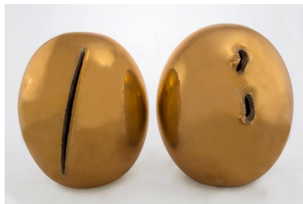
Robertaebasta: Lucio Fontana (Argentinië, 1899-1969 Italië), Concetto Spaziale Natura , 1967, gepolijst messing, H 26 x B 20 x D 21 cm

'Het schitterende materiaal van gepolijst messing verleent de doorsneden van deze stukken van Fontana een ruwe aanblik en de sculpturen een quasi industriële dimensie.' Ze verklaart: 'Ik was bijzonder aangetrokken door hun uiteenlopende karakter – het lijkt wel de bedoeling om karakter te geven aan elk stuk individueel en tegelijk een mooie cohesie te behouden als paar. Ik zie ze perfect samen op een sokkel.'