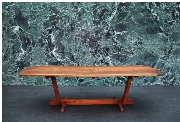
New Hope Gallery: George Nakashima (VS, 1905-1990), Conoid-eettafel , Amerikaans zwart walnotenhou, New Hope, VS, 1971