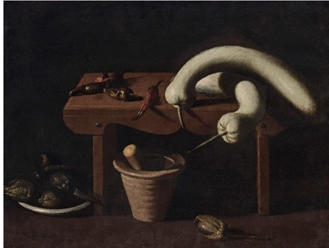
Nicolás Cortés Gallery: Francisco de Zurbarán (Spanje, 1598-1664), Vasten-stillevan , 17e eeuw