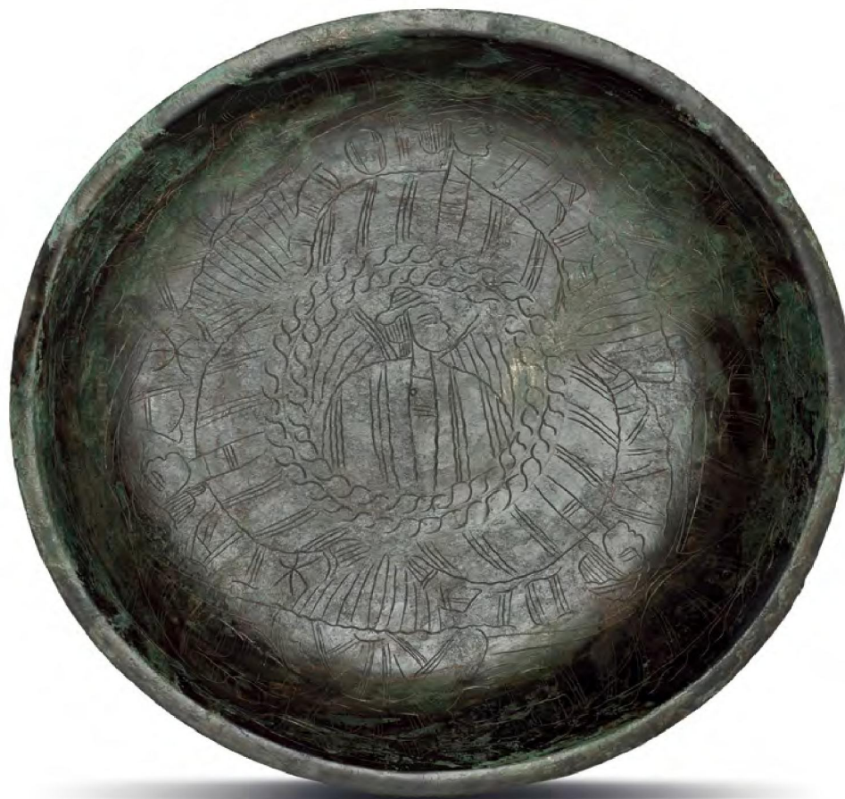
Duitsland, mogelijk Saksen. Bronslegering, roodkoper en zink. Diameter 26 cm, hoogte circa 5 cm.