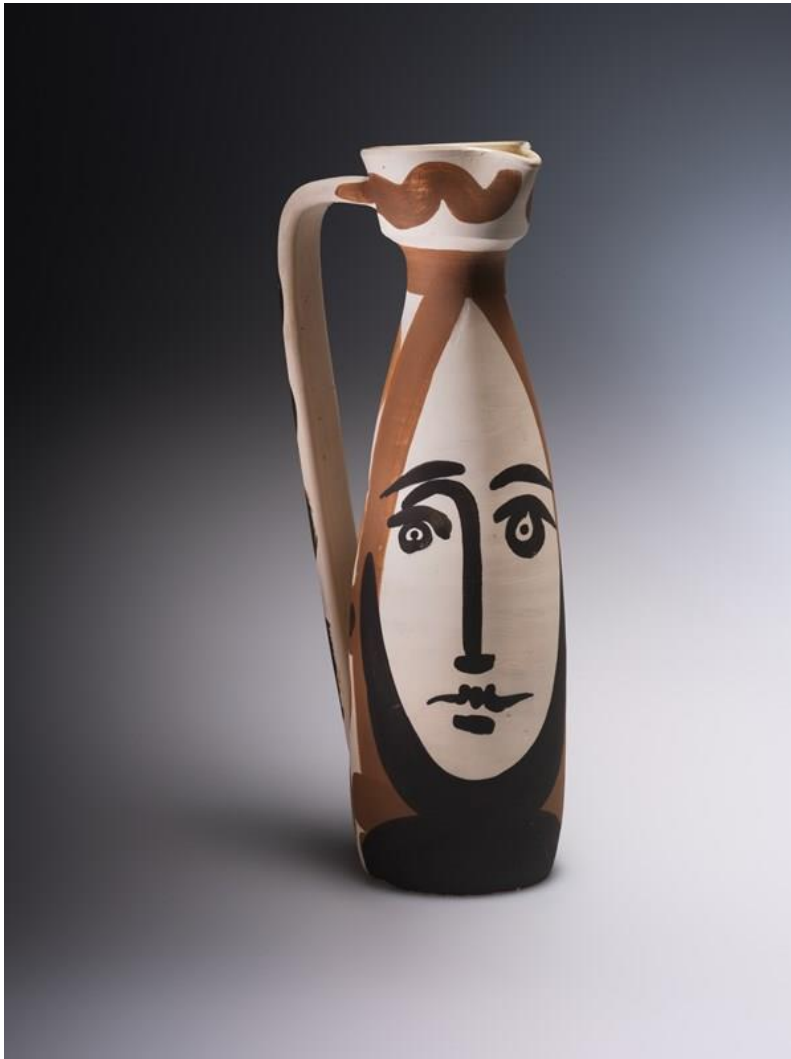
Pablo Picasso, waterkruik