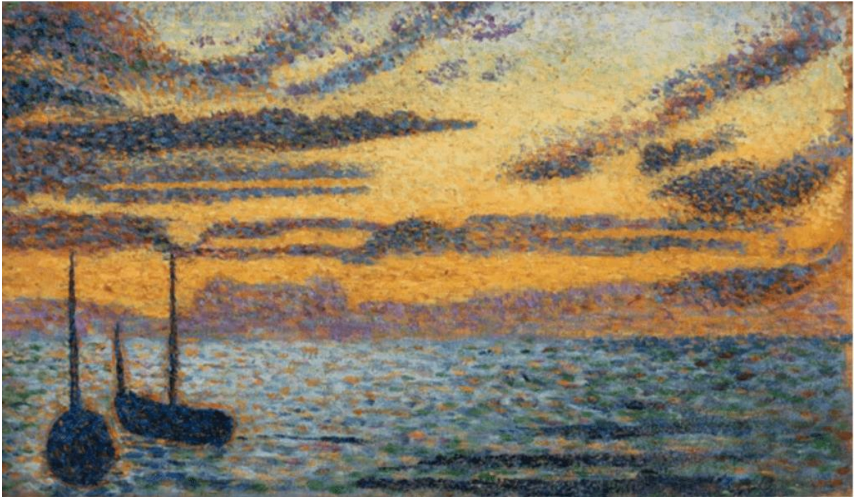
Georges Lemmen, Knokke-Heyst , 22 augustus 1891, olieverf op plank, 12,5 x 21,5 cm

grotere deelname van antiquairs als tegenhanger van de moderne en hedendaagse kunst.' In de grootste stand van BRAFA 2022 brengt Francis Maere als gebruikelijk de Vlaamse Meesters met ditmaal nadruk op de sculpturen en tekeningen van Eugène Dodeigne.