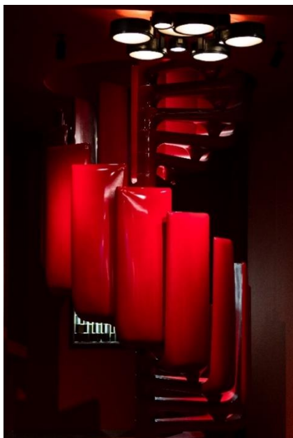
BRAFA 2023 - MORENTZ

Presentate da una decina di grandi professionisti del settore, le opere di design hanno avuto un ruolo non secondario nel successo di questa edizione. Imperdibili la scala in poliestere rosso di Georges Ferran per Axe, realizzata in schiuma di poliestere, acciaio e lacca, (Francia, 1971) presentata dalla galleria MORENTZ (NL); le appliques di Giò Ponti "Finestra" Arredoluce del 1957 o le sedie "Artona" disegnate da Afra e Tobia Scarpa per Maxalto nel 1975 presentate da Robertaebasta (IT).