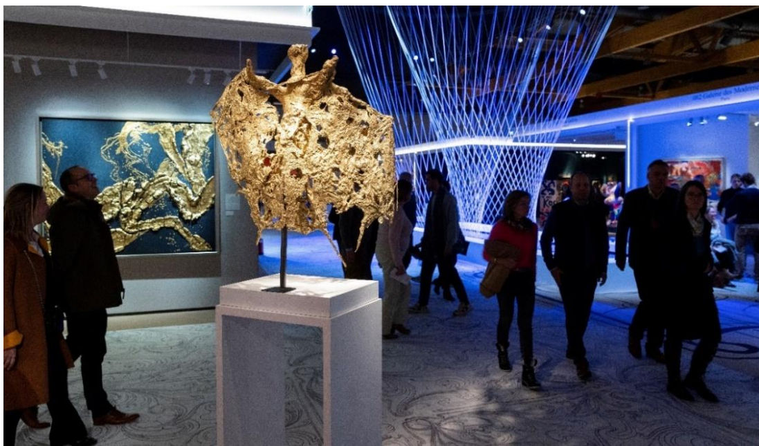
BRAFA 2023 - Vista generale