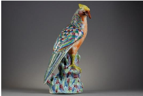
Figure d'un faisan doré sur un rocher Porcelaine polychrome Chine, période Qianlong (1736-1795), vers 1750-1770 H 35,5 cm

Ce faisan doré est un admirable travail de la dynastie Qing sous l'empereur Qianlong qui date du XVIII e siècle. Le détail et le travail de l'oiseau en font un objet très recherché et rare par sa taille imposante.