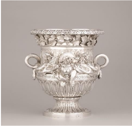
Rafrâchissoir en argent Vienne, 1782 Maître orfèvre Ignaz Joseph Würth

Cet extraordinaire seau à rafraîchir, avec un haut relief représentant deux peaux de lion, entourées de lierre et d'attributs de musique, provient d'un service réalisé entre 1779 et 1782 pour Albert de Saxe-Teschén, Gouverneur général des Pays-Bas, occupant à l'époque le Château de Schonenberg, actuel Château de Laeken à Bruxelles. Ce service reste le seul exemple d'argenterie viennoise de la seconde moitié du XVIIIe siècle qui ait été épargnée par les ravages des guerres napoléoniennes.