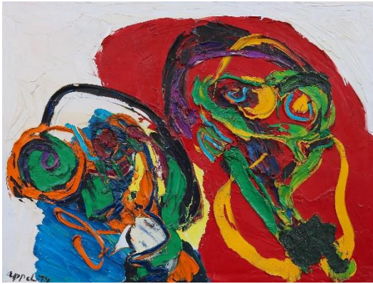
Karel Appel (Amsterdam 1921-2006 Zurich) Sans titre, 1974 Huile sur toile 75 x 100 cm Signée et enregistrée à la Fondation Karel Appel

En 1948, Karel Appel devient cofondateur du mouvement CoBrA avec Guillaume Cornelis van Beverloo, Constant Nieuwenhuys, Asger Jorn, Jan Nieuwenhuys et Christian Dotremont.