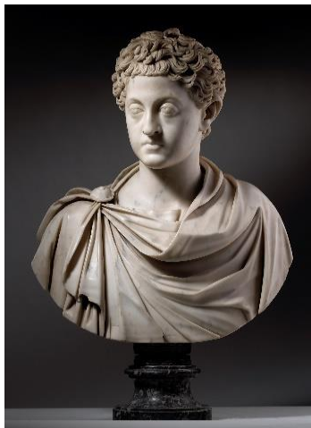
Bartolomeo Cavaceppi (1716-1799) (attribué à) Le jeune empereur Commode Marbre blanc, marbre de Saint Anne Rome, fin du XVIIIe siècle H 72 x L 54 x P 25 cm

Ce buste extrêmement raffiné représente Commode, un empereur romain qui a régné de 177 à 192. Il a servi conjointement avec son père Marc Aurèle de 177 à la mort de ce dernier en 180, puis a régné seul jusqu'à son assassinat. Son règne est généralement considéré comme marquant la fin d'une période dorée de paix dans l'histoire de l'Empire romain, connue sous le nom de Pax Romana.