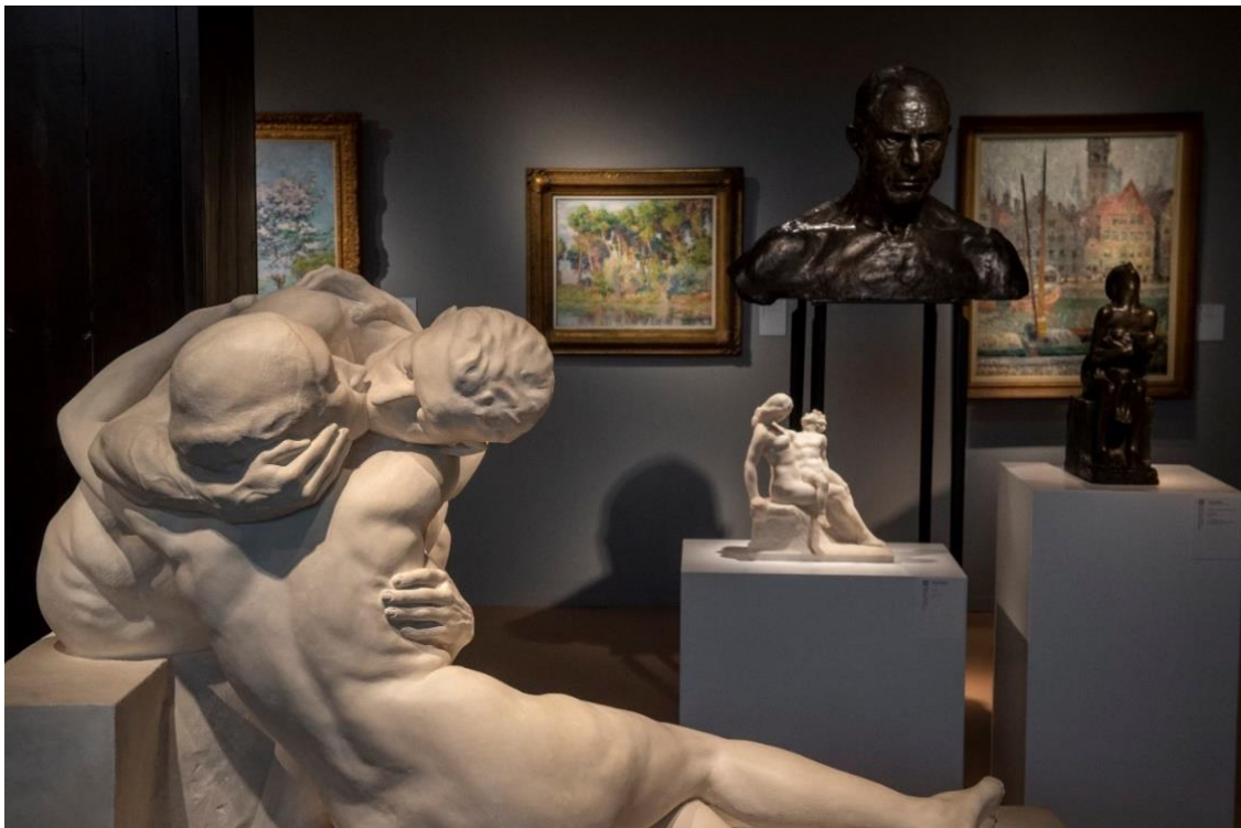
BRAFA Art Fair 2022 - Francis Maere Fine Arts