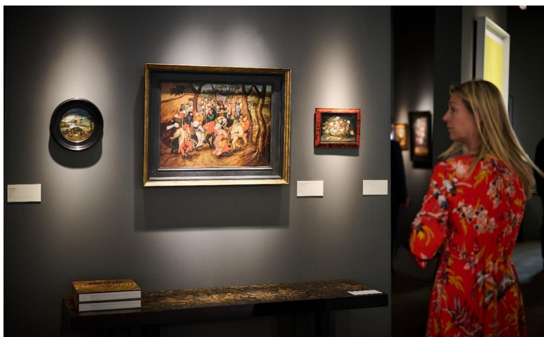
BRAFA Art Fair 2022 - De Jonckheere

BRAFA 2023: BRAFA neemt haar vaste plaats in januari op de internationale kunstbeurskalender weer in