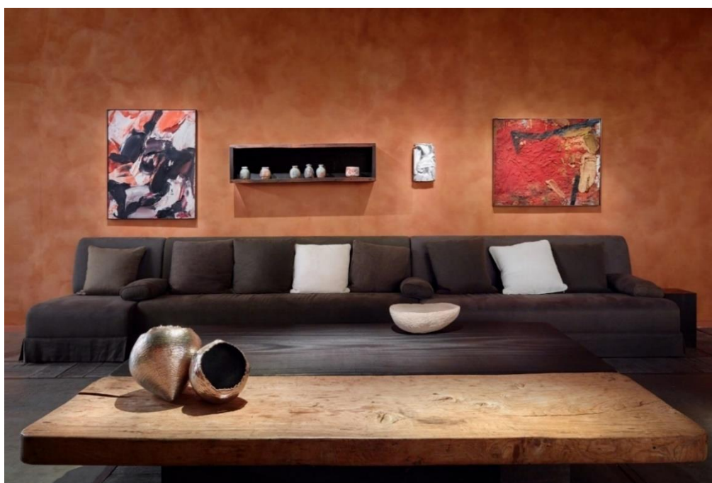
BRAFA 2022 - Axel Vervoordt - Fotograaf Jan Liégeois © Axel Vervoordt