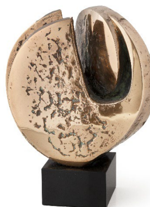
Bouclier , 1970

Bronze poli sur socle en marbre Noir de Mazy