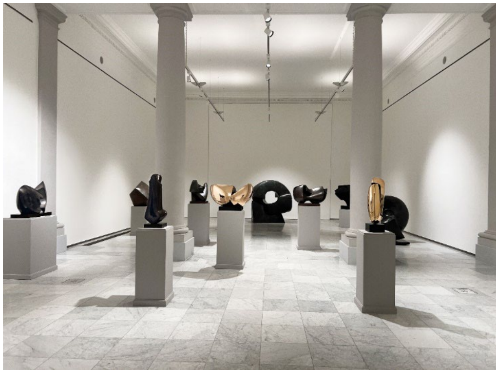
Jean-Pierre Ghysels aux Musées royaux des Beaux-Arts de Belgique