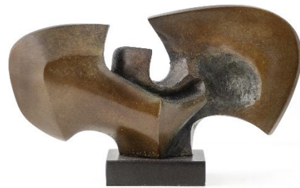
Antioche , 1987 Bronze patiné sur socle en marbre Noir de Mazy Signé « GHYSELS » 16 x 21 x 8,5 cm