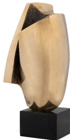
Incantation , 1971 Bronze sur socle en marbre Noir de Mazy Signé « JP. GHYSELS » 26,5 x 12 x 12 cm