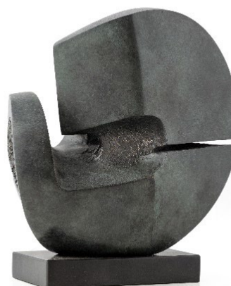
Citadelle , 1973

Bronze patiné sur socle en marbre Noir de Mazy