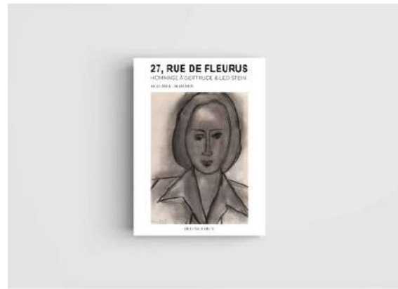
27 rue de Fleurus Hommage à Gertrude & Leo Stein