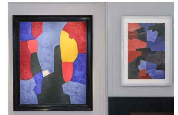
POLIAKOFF ET LA GÉNÉRATION PARISIENNE 05.03.2025 - 03.05.2025