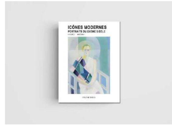
Icônes Modernes Portraits du XXème Siècle