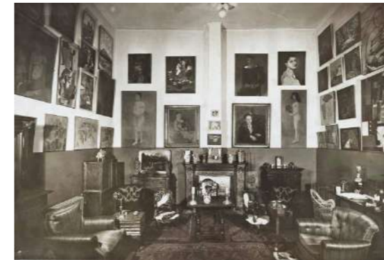
27 RUE DE FLEURUS HOMMAGE À GERTRUDE & LEO STEIN 18 décembre 2024 - 1er mars 2025