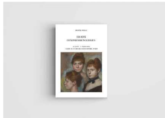
150 ans d'Impressionnisme