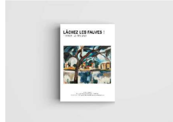
Lâchez les fauves !