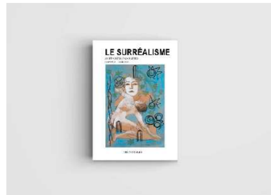
Le Surréalisme Supports Insolites