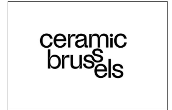
CERAMIC BRUSSELS Tour&Taxis | Stand CB25 22 - 27 janvier 2025