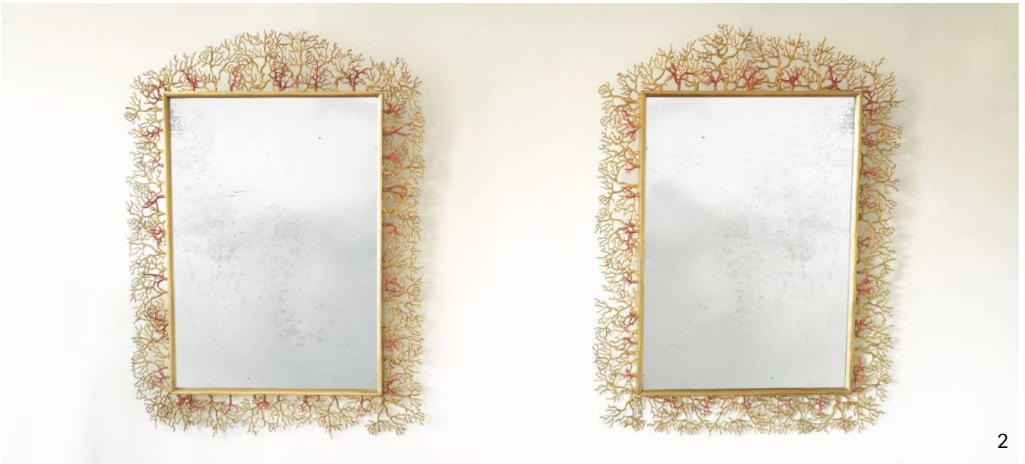
Paire de Miroirs Corail en bronze doré et corail de Méditerranée

Cette rétrospective inédite, qui se tiendra du 3 avril au 31 mai 2025 au 7 quai de Conti dans le 6e arrondissement parisien, présentera plus d'une vingtaine de pièces iconiques, lustres, miroirs, et objets d'art, une sélection de « bijoux d'intérieur » uniques et historiques, réalisés de son vivant et de la main de l'artiste.