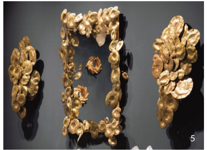
Miroir et Appliques Nénuphar

Deux génies iconiques de la mode française, pour lesquels Robert Goossens a conçu des bijoux et des objets d'exception, aux inspirations multiples et qui chacun marqueront le style de ces grandes maisons.