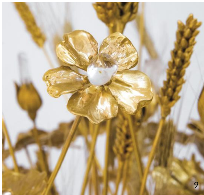
Sculpture en bronze doré, laiton, épis de blé, et cristal de roche

Entré en apprentissage dès ses plus jeunes années chez un orfèvre de renom, puis dans un atelier de gravure, un père fondeur d'art, Robert Goossens a côtoyé les meilleurs artisans d'art de l'époque avec lesquels il a perfectionné sans relâche son savoir-faire multiple (sertissage, gravure, email, ...). Artisan de génie à l'esprit créatif et la curiosité insatiables, Robert Goossens s'est imposé comme l'un des créateurs marquants du XX e siècle qui a su lier l'histoire des grandes maisons de couture et les Arts décoratifs.