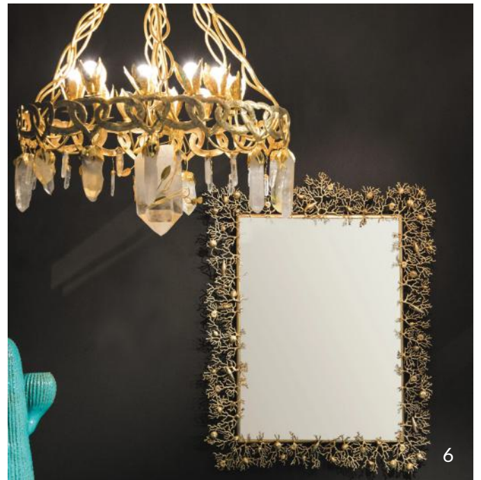
Lustre Coeur et Miroir Corail