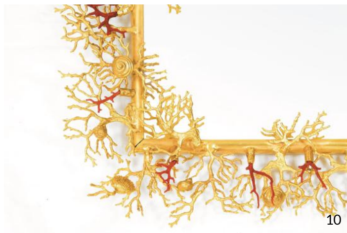
Miroir Corail en bronze doré et corail de Méditerranée