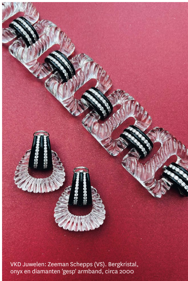
VKD Juwelen: Zeeman Schepps (VS). Bergkristal, onyx en diamanten 'gesp' armband, circa 2000

BRAFA's 70 e editie wordt extra feestelijk dankzij de aanwezigheid van de internationaal gerenommeerde Portugese kunstenaar Joana Vasconcelos (1971) als eregast. Vasconcelos staat bekend om haar monumentale installaties en sculpturen, die een boeiende mix bieden van humor, maatschappelijk