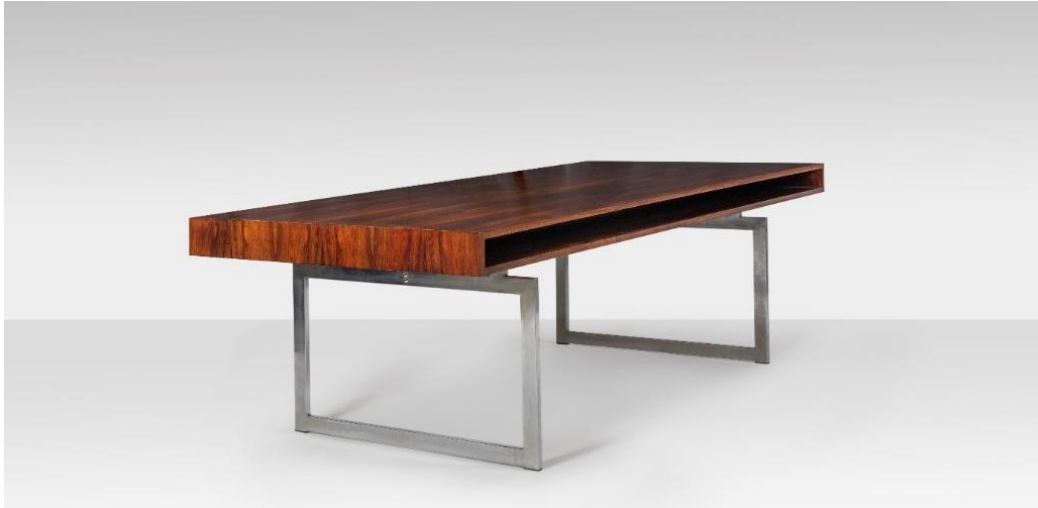
Gokelaere & Robinson: Bodil Kjaer (Hatting, 1932), Presidentsbureau , 1959. Rozenhout, staal. H 72 x B 210 x D 100 cm

Dit schitterende rozenhouten bureau is in 1959 ontworpen door de Deense kunstenaar-designer Bodil Kjaer en vervaardigd door E. Pedersen & Son in Denemarken als onderdeel van een project voor het Massachusetts Institute of Technology. Deze klassieker bezit een ontzettend uitgepuurd design, met heldere en verfijnde lijnen. Het maakt het er niet minder geliefd om, vermits het meermaals gebruikt werd in films, waaronder drie James Bond-films. Dit bureaumodel maakte tevens deel uit van de collectie van beroemdheden als acteur Michael Caine, pianist Oscar Peterson, alsook prins Philip, de hertog van Edinburgh.