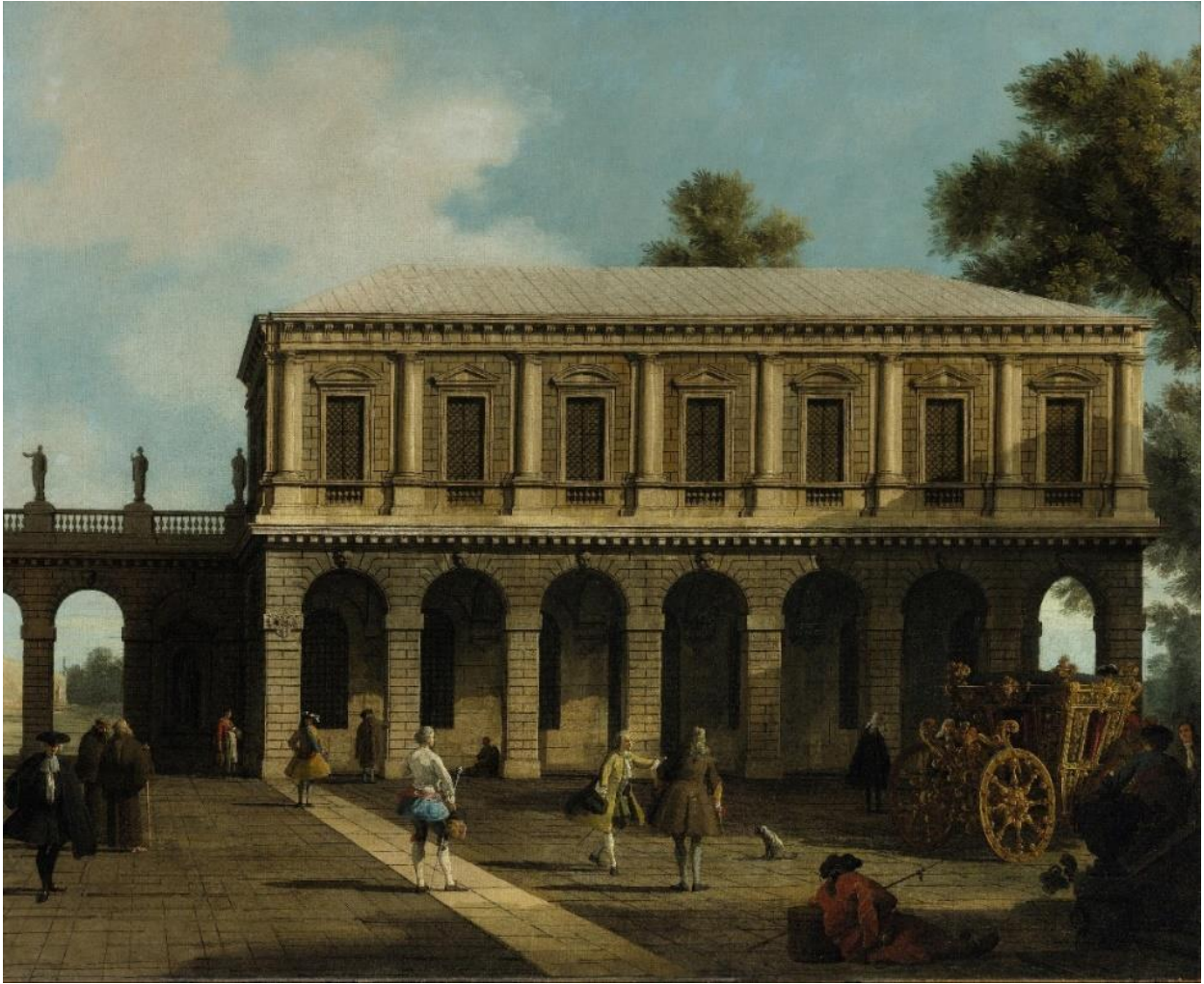
DYS44 Lampronti Gallery: Giovanni Antonio Canal (Venetië, 1697-1768), Capriccio van de San Marco-gevangenissen , ca. 1744. Olie op doek, 105.5 x 127.5 cm