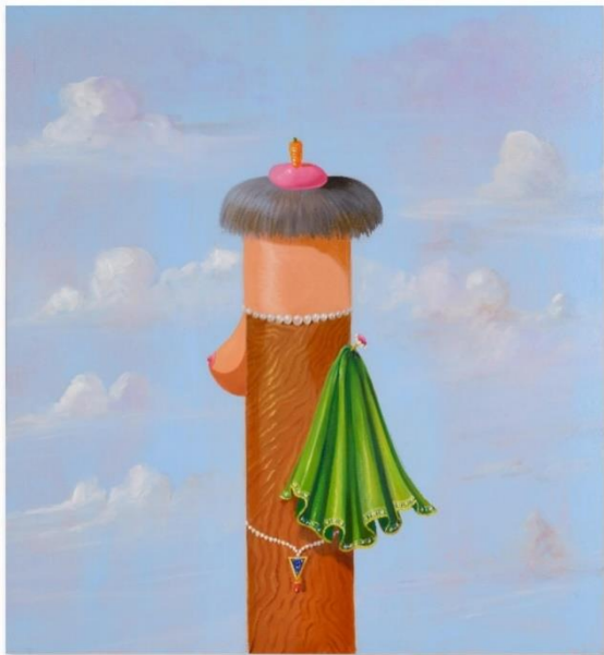
Galerie von Vertes: George Condo (New Hampshire, Concord, 1957), Vrouwelijke compositie , 2006. Olie op doek. 165.1 x 152.4 cm

Zoals Giorgio de Chirico's 'Manichini' of metafysische poppen die het gezicht als status- en identiteitssymbool verwerpen, vat Vrouwelijke Compositie Condo's concept van 'Artificieel Realisme' perfect samen. Via dit portret drijft hij immers de spot met de traditionele voorstellingen van vrouwelijkheid zoals die te zien zijn op de werken van Rembrandt en Picasso. Deze ironische interpretatie beeldt een gezichtsloze vrouw af met borsten, een cape, een halssnoer, alsook een hoofd bedekt met een hoed en een wortel.