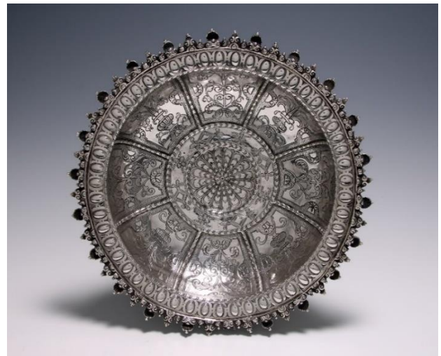
J. Baptista: Zilveren zoutschaal , Portugal, eind 16e eeuw. Ø 33 cm, 1050 gr.

Deze concave zilveren zoutschaal is een opmerkelijk voorbeeld van laat 16e-eeuws Portugees zilverwerk, dat vaak een gebruiksfunctie vervulde in de huishoudens van de belangrijke families uit die tijd. Dergelijke stukken, rijkelijk versierd met geometrische elementen, krullen en schelpmotieven, getuigen van de artistieke verfijning en bekwaamheid van de toenmalige Portugeese ambachtslui. De historische en artistieke waarde van dit object blijkt ook uit de aanwezigheid ervan in de collecties van prestigieuze musea, zoals in het Museu Nacional de Arte Antiga in Lissabon, het Museo Lázaro Galdiano in Madrid en het Metropolitan Museum of Art in New York.