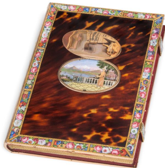
Artimo Fine Arts: 'album amicorum' automaatboekje met vragen en antwoorden voor tovenaars, met originele lederen etui en handleiding. Gesigneerd Meussel et Fils, Genève, maart 1823. Goud, email en schildpad. H 20 x B 15 cm (uniek stuk)