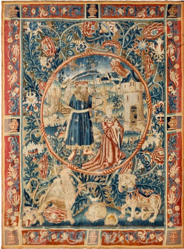
Dei Bardi Art: Vlaams wandtapijt Martelaarschap van de Heilige Barbara , Brugge, ca. 1525-1550. Wol en zijde. H 270 x B 198 cm

Dit Vlaamse wandtapijt waarop Martelaarschap van de Heilige Barbara is afgebeeld, getuigt van buitengewoon 16e-eeuws vakmanschap, dat zich onderscheidt door een kleurenpalet waarop de tijd amper vat heeft gehad. Brugge was rond 1500 een gerenommeerd weefcentrum en er zijn tal van wandtapijten geïnventariseerd, maar slechts heel weinige zijn bewaard gebleven, hetgeen dit stuk bijzonder zeldzaam maakt. De dramatische voorstelling van de beul die met een gebogen sabel dreigt, herinnert aan de historische context van die tijd, met de Ottomaanse invallen in Centraal-Europa. Dankzij dit detail kunnen we het wandtapijt dateren omstreeks het tweede kwart van de 16e eeuw.