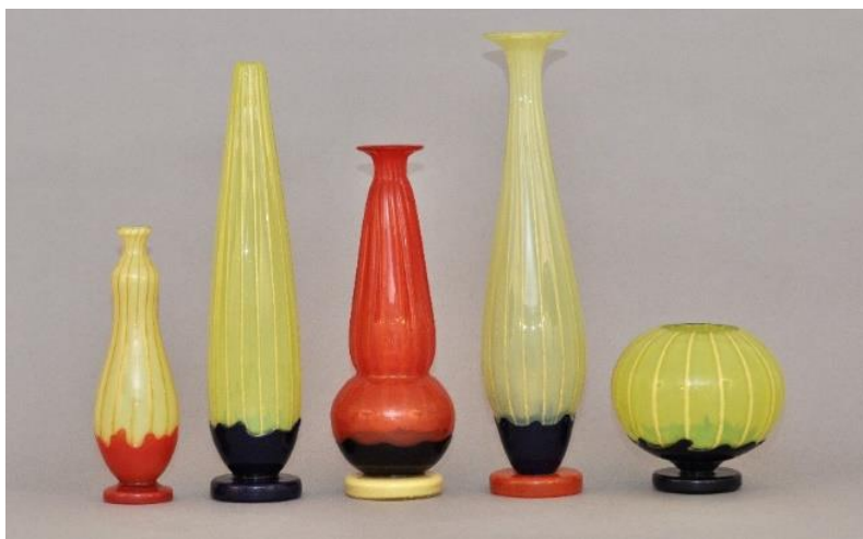
Kunstconsult 20th century art I objects: Reeks van vijf geribde vazen van de hand van Charles Schneider (Château-Thierry 1881-1953 Épinay-sur-Seine), ca. 1925. Helder en opaalglas in verschillende kleuren, handgeblazen en gemodelleerd, met verticaal aangebrachte ribben.