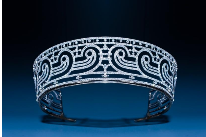
Epoque Fine Jewels: diamanten Art Deco diadeem, Maison Chaumet, Parijs 1909

Dit diadeem werd in 1919 in Parijs door Maison Chaumet vervaardigd voor het huwelijk van de dochter van graaf en gravin van Heeren. Het toont een reeks afgeronde Griekse motieven, gezet met 2096 diamanten, gemonteerd op platina en goud, met een typische 'mille-grain'-afwerking. Sloten de meeste diademen uit die periode aan op de 19e-eeuwse 'guirlande'- of traditionele stijl, dit stuk vormt een vroeg voorbeeld van de geometrische esthetiek die de Art Deco periode zou gaan bepalen en die haar hoogtepunt bereikte in de jaren 1920. Het in 1780 opgerichte Maison Chaumet heeft ruim 2000 prestigieuze diademen ontworpen.