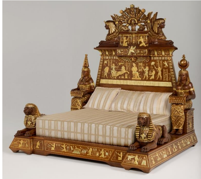
Galerie Marc Maison: Louis Malard, Monumentaal bed in Egyptomanie-stijl, 19e eeuw. Notelaar met polychromie. H 271 x B 232 x D 260 cm

Dit bed werd voorgesteld op de Wereldtentoonstelling van 1889 in Parijs en maakt deel uit van een volledig slaapkamerensemble. Dit werk is absoluut tekenend voor de 19e-eeuwse Egyptomanie. Voor zijn ontwerper, meubelmaker Louis Malard, volstond het immers niet om enkele motieven toebehorend aan het ornamentale repertoire van het oude Egypte over te nemen, zoals de Empirestijl uit het begin van de 19e eeuw dat kon doen. Hij verveelvoudigde daarentegen de verwijzingen om een oeuvre te ontwerpen met een unieke stijl. Dat uit zich zowel in de grootte van het bed, in zijn architecturale hemel, als in de levensgrote zittende figuren die langs weerszijden dienen als nachtkastjes, in de houding van de enorme Egyptische zittende beelden.