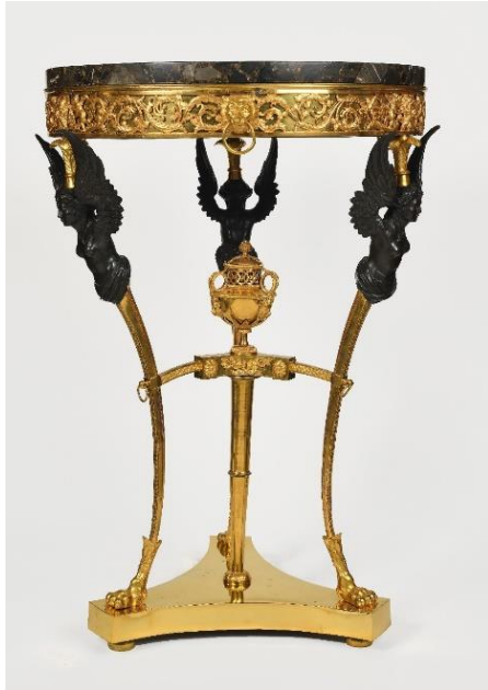
Gallery de Potter d'Indoye: Pronktafeltje , toegeschreven aan Pierre-Philippe Thomire (Parijs, 1751-1843), ca. 1790. Verguld en gepatineerd brons, marmereen blad, H 90.25 x Ø 62.25 cm