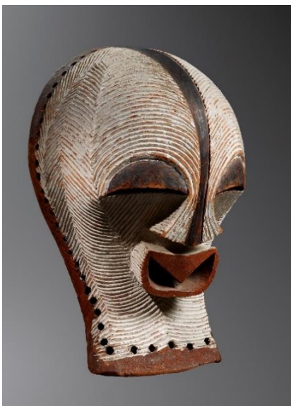
Claes Gallery: Songye-masker, Democratische Republiek Congo, Katanga. Geschatte periode: eind 19e-begin 20e eeuw. Hout, pigmenten. H 31,8 cm

Dit bed werd voorgesteld op de Wereldtentoonstelling van 1889 in Parijs en maakt deel uit van een volledig slaapkamerensemble. Dit werk is absoluut tekenend voor de 19e-eeuwse Egyptomanie. Voor zijn ontwerper, meubelmaker Louis Malard, volstond het immers niet om enkele motieven toebehorend aan het ornamentale repertoire van het oude Egypte over te nemen, zoals de Empirestijl uit het begin van de 19e eeuw dat kon doen. Hij verveelvoudigde daarentegen de verwijzingen om een oeuvre te ontwerpen met een unieke stijl. Dat uit zich zowel in de grootte van het bed, in zijn architecturale hemel, als in de levensgrote zittende figuren die langs weerszijden dienen als nachtkastjes, in de houding van de enorme Egyptische zittende beelden.