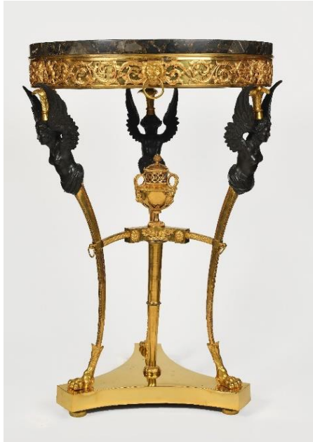
Gallery de Potter d'Indoye: Pronktafeltje , toegeschreven aan Pierre-Philippe Thomire (Parijs, 1751-1843), ca. 1790. Verguld en gepatineerd brons, marmeren blad, H 90.25 x Ø 62.25 cm

Dit pronktafeltje, toegeschreven aan Pierre-Philippe Thomire, de vaste ciseleur en vergulder van koning Lodewijk XVI, maakt deel uit van een groep gelijkaardige pronktafeltjes uit verguld en gepatineerd brons, rustend op een driepotige basis in de vorm van een griffioen. Eén exemplaar bevindt zich in het Museum Nissim de Camondo in Parijs, verworven van leverancier Seligmann, als van de hand van Thomire, een ander bevond zich in de collectie van Boniface de Castellane en Anna Gould in het Palais Rose in Parijs, verkocht bij Christie's Parijs op 17 maart 2017, lot 116. Een derde model maakte deel uit van de collectie van Helena Rubinstein en John Dorrance en behoort nu toe aan Dalva Brothers, New York.