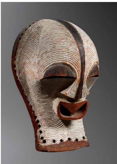
Claes Gallery: Songye-masker, Democratische Republiek Congo, Katanga. Geschatte periode: eind 19e-begin 20e eeuw. Hout, pigmenten. H 31,8 cm