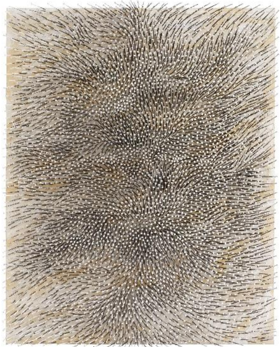
Boon Gallery: Günther Uecker (Wendorf, 1930), Wind , 2005. Spijkers. Olieverf, doek op hout, 200 x 160 cm

Sinds zes decennia ontwikkelt Günther Uecker dynamische spijkerreliëfs. In de jaren 50 begon hij onder invloed van de Oosterse filosofie en de Gregoriaanse zang aan zijn spijkerritueel. Spijkers staan voor de kunstenaar symbool voor bescherming, vermits hij zich herinnert dat hij planken voor de ramen van zijn huis vastspijkerde tijdens de inval van de Sovjettroepen na de Tweede Wereldoorlog. Vanaf 1957 sloeg hij spijkers op doeken om een optisch effect van 'zonnwijzer' te verkrijgen, waarbij de compositie in het juiste licht een tweede schaduwtekening op de ondergrond vormt. In 1961 vervoegde Uecker Heinz Mack en Otto Piene de anti-expressionistische Zero-beweging, die de traditionele dimensies van het doek verwierp om kinetische, seriële en participatieve domeinen te verkennen.