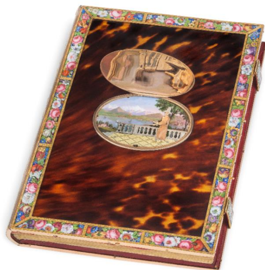
Artimo Fine Arts: 'album amicorum' automaatboekje met vragen en antwoorden voor tovenaars, met originele lederen etui en handleiding. Gesigneerd Meussel et Fils, Genève, maart 1823. Goud, email en schildpad. H 20 x B 15 cm (uniek stuk)