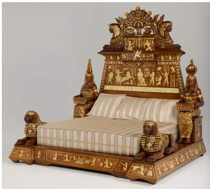
Galerie Marc Maison: Louis Malard, Letto monumentale in stile egittomania, XIX secolo. Noce con policromia, H 271 x L 232 x P 260 cm

Presentato all'Esposizione Universale di Parigi del 1889, questo letto faceva parte di un set completo per la camera da letto. Quest'opera è altamente indicativa dell'egittomania che ha attraversato il XIX secolo. Ben oltre il semplice prestito di alcuni motivi dal repertorio ornamentale dell'Antico Egitto, usuale nello stile Impero di fine secolo. Il suo creatore, l'ebanista Louis Malard, moltiplicò i riferimenti per dare vita a un'opera dallo stile unico. Ciò si riflette nelle dimensioni del letto, nel suo baldacchino architettonico e nelle figure sedute a grandezza naturale che fungono da comodini ai lati, riprendendo la postura delle immense statue egizie sedute.