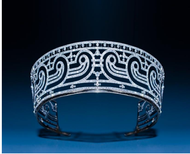
Diadema di diamanti Art Déco, Maison Chaumet, Parigi 1909

Questo diadema fu realizzato a Parigi nel 1909 dalla Maison Chaumet per il matrimonio della figlia del conte e della contessa de Heeren. Presenta una serie di motivi greci arrotondati, con 2096 diamanti incastonati, montati in platino e oro, con una tipica finitura "mille grani". Mentre la maggior parte dei diademi dell'epoca erano in stile guirlande o tradizionale del XIX secolo, questo pezzo è un primo esempio dell'estetica geometrica che definirà il periodo dell'Art Déco, che raggiunse il suo apogeo negli anni Venti. Fondata nel 1780, la Maison Chaumet ha disegnato più di 2000 splendidi diademi.