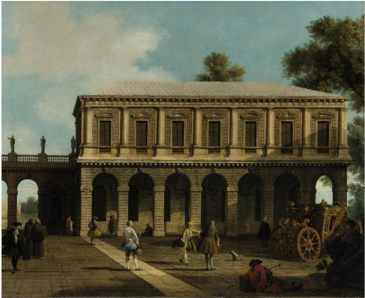
DYS44 Galleria Lampronti : Giovanni Antonio Canal (Venezia, 1697-1768), Capriccio delle prigioni di San Marco , 1744 circa. Olio su tela, 105,5 x 127,5 cm

Giovanni Antonio Canal, noto come Canaletto, è stato un pittore italiano celebre per le sue splendide rappresentazioni di paesaggi e città veneziane. Si guadagnò la popolarità per le sue "vedute" - rappresentazioni dettagliate e pittoresche di scorci cittadini - e per i "capricci" - composizioni architettoniche fantasiose che mescolavano realtà e fantasia. Le sue opere ebbero particolare risonanza presso gli aristocratici britannici in visita a Venezia. Quest'opera fu dipinta per il grande mecenate e agente dell'artista Joseph Consul Smith, come parte di una serie di tredici tele, presumibilmente destinate a decorare il Palazzo Mangilli-Valmarana, la casa di Smith sul Canal Grande proprio sopra il Ponte di Rialto. Nel 1762 Smith vendette la parte più pregiata della sua collezione al re Giorgio III d'Inghilterra, compreso questo dipinto.