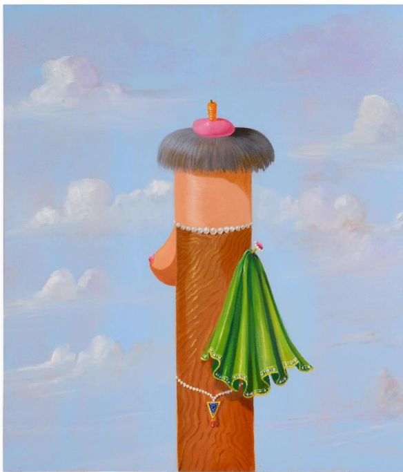
Galerie von Vertes: George Condo (New Hampshire, Concord 1957), Composizione femminile , 2006. Olio su tela, H 165,1 x L 152,4 cm

Come i "Manichini" o le figure metafisiche di Giorgio de Chirico, che rifiutano il volto come simbolo di status e identità, Female Composition racchiude perfettamente il concetto di Realismo Artificiale di Condo. Attraverso questo ritratto, Condo si fa beffe delle rappresentazioni tradizionali della femminilità, come quelle di Rembrandt e Picasso. Questa ironica interpretazione raffigura una donna senza volto con un seno, un mantello, una collana e una testa sormontata da un cappello e da una carota.