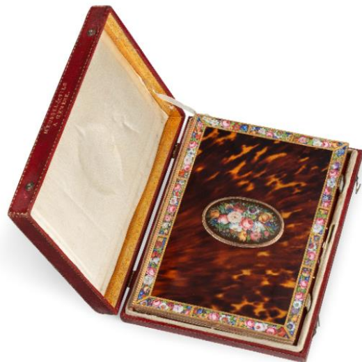
Artimo Fine Arts: libro "album amicorum" del mago automa a domande e risposte, con custodia originale in pelle e istruzioni per l'uso. Firmato Meussel et Fils, Ginevra, marzo 1823. Oro, smalto e tartaruga, H 20 x L 15 cm (pezzo unico)