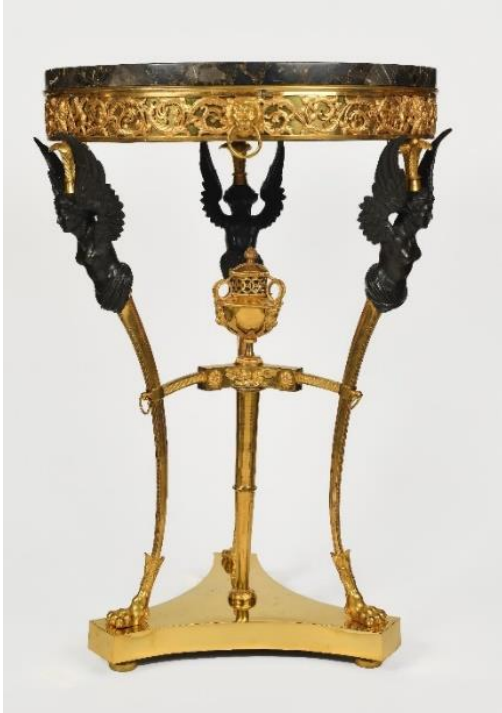
Gallery de Potter d'Indoye: Guéridon , 1790 circa. Attribuito a Pierre-Philippe Thomire (Parigi, 1751-1843). Bronzo dorato e patinato, con piano in marmo, H 90,25 cm x Ø 62,25 cm