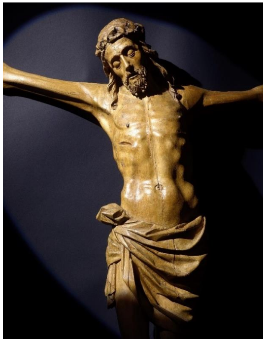
Mearini Fine Art: Crocifisso , 1490 circa, legno di ontano, H 115 x L 92 x P 16 cm

Un'anteprima di 14 capolavori imperdibili di BRAFA 2025