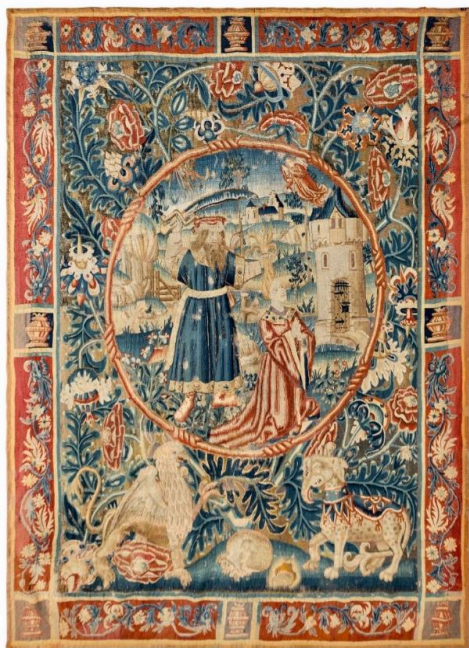
Arte Dei Bardi: Il martirio di Santa Barbara . Arazzo fiammingo, Bruges, 1525-1550 circa. Lana e seta, 270 x 198 cm

Questo arazzo fiammingo, raffigurante Il martirio di Santa Barbara , rappresenta un notevole esempio di artigianato del XVI secolo, e si distingue per la sua tavolozza di colori eccezionalmente ben conservata. Bruges era un importante centro tessile in questo periodo, con numerosi arazzi documentati negli inventari contemporanei. Tuttavia, pochissimi sono sopravvissuti, il che rende questo esemplare particolarmente raro e prezioso. La raffigurazione del boia che brandisce una sciabola ricurva è un forte richiamo al contesto storico dell'epoca, che riflette le incursioni ottomane nell'Europa centrale. Questo dettaglio aiuta a datare l'arazzo al secondo quarto del XVI secolo.