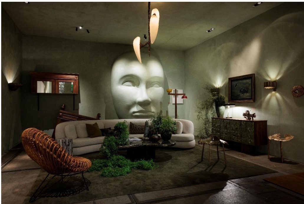
BRAFA 2024 - Delen