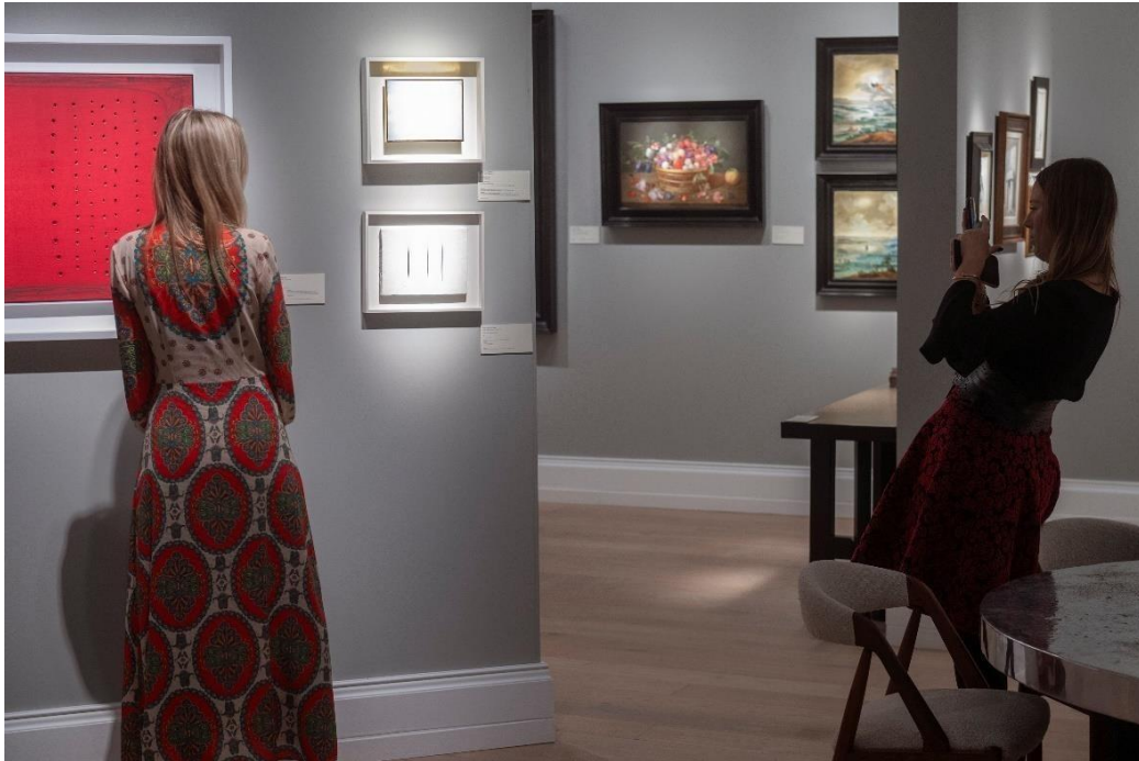
BRAFA 2024: De Jonckheere