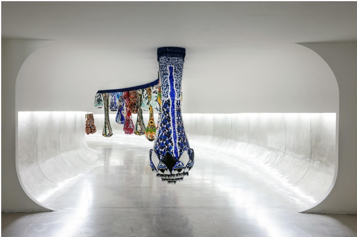
Dream Curtain , 2023 © Andre Nacli - Courtesy Museu Oscar Niemeyer

A BRAFA 2025 esporrà due Valchirie, sculture ispirate alle figure femminili della mitologia norrena che sorvolavano i campi di battaglia riportando in vita i guerrieri più coraggiosi per unirsi alle divinità del Valhalla. Realizzate in tessuto, danno piena espressione alla creatività dell'artista, coinvolgendo una varietà di tessuti, ganci e passamanerie. Il risultato è una sorprendente combinazione di volumi, texture e colori. Composte da un corpo centrale, una testa, una coda e diverse braccia, molte delle Valchirie combinano l'artigianato tradizionale con metodi più tecnologici, come l'inserimento di luce per simulare la vibrazione e la respirazione, che dà movimento all'opera.