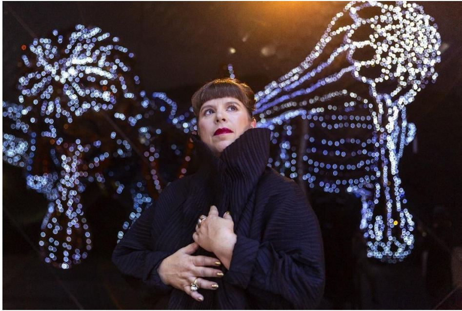
Joana Vasconcelos © Lionel Balteiro | LaMousse - Courtesy Atelier Joana Vasconcelos